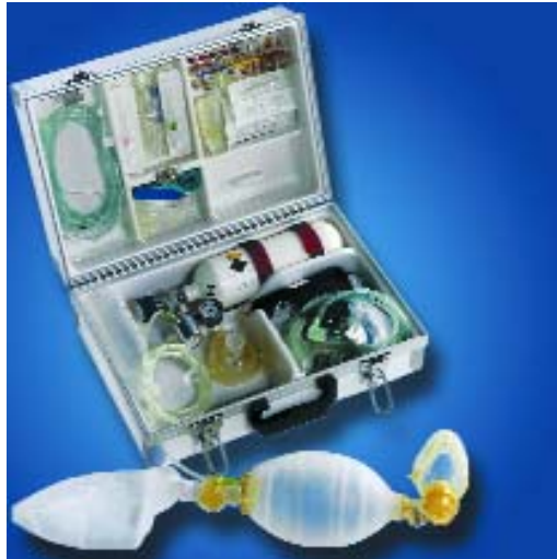
Abb. 2: Der Basisnotfallkoffer „reanimed-dental“ wurde speziell für die Zahnarztpraxis konzipiert.