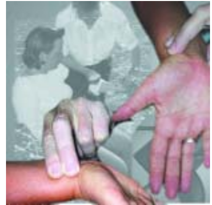
Abb. 3: Puls tasten: Am leicht überstreckten, beugeseitigen Handgelenk daumenseitig tasten sie die A. radialis.

Als einfacher Merksatz gilt: Plötzlich einsetzende Schmerzen, die zwischen Bauchnabel und Unterkiefer lokalisiert sind, sollten so lange dem Herzinfarkt zugeordnet werden bis das Gegenteil bewiesen ist.