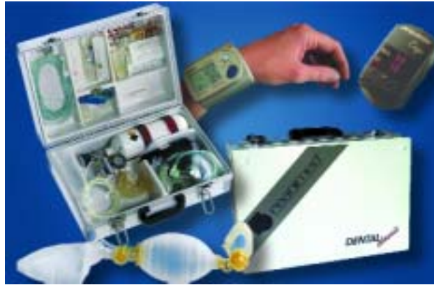
Abb. 2: Reanimed dental classic – der Notfallkoffer von Notärzten für Zahnärzte „Weniger ist mehr“. Reanimed dental plus – der NK reanimed dental classic mit automatischem Blutdruckgerät und Pulsoxymeter